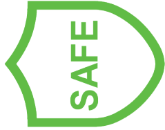
ចាប់ផ្តើមមានសុពលភាព

បុព្វលាភប្រចាំឆ្នាំដែលអ្នកស្រីត្រូវបង់គឺ $855